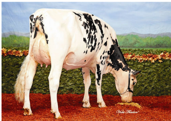
MARYCLERC C MANIFOLD DELLIMA