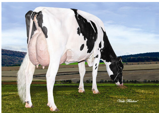
LINDENRIGHT MANIFOLD DIME